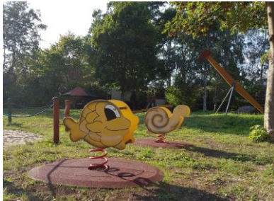
Die beiden neuen Schaukeltiere runden das Angebot für unsere Kleinsten ab.

Der Ortsteilrat hatte sich, im Rahmen der Umsetzung des neuen Spielstätten-Konzeptes der Stadt Gotha, dafür eingesetzt, dass unser Spielplatz durch weiteres Spielgerät aufgewertet und vor allem etwas für die kleinsten Mitbürger geschaffen wird. Damit war der derzeit amtierende Ortsteilrat einer Empfehlung seiner Vorgänger gefolgt, die diese Beschaffung ebenfalls angeregt hatten.