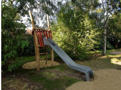
Das Bild zeigt die neue Rutsche auf unserem Spielplatz

Seit kurzem verfügt unser Boilstädter Spielplatz über drei neue Spielgeräte. Eine Rutsche und zwei Schaukeltiere , die durch das Garten-, Park- und Friedhofsamt der Stadt Gotha installiert worden sind, stehen nun zum Spielen und Toben bereit.